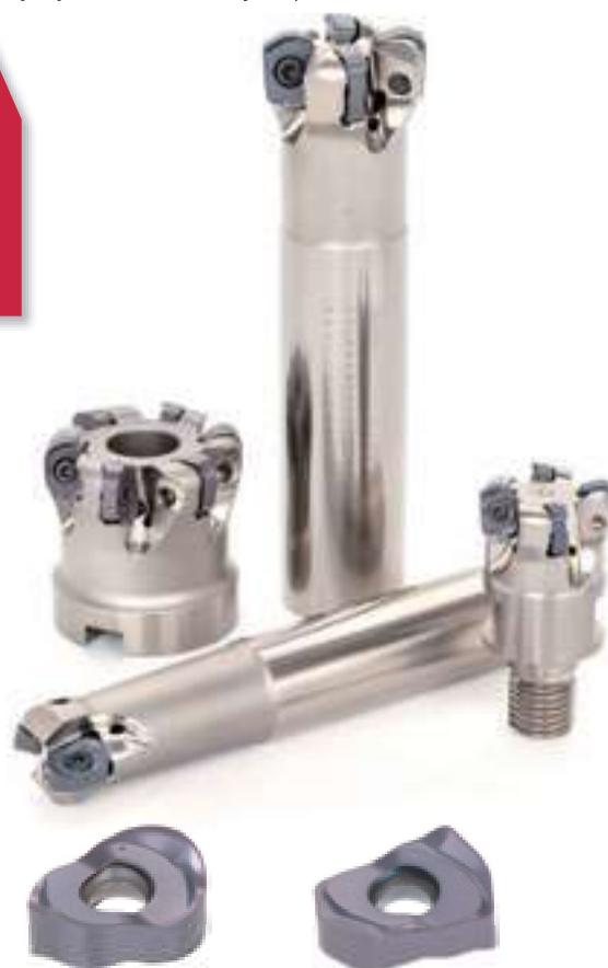
LNMX...MJ / ML Płytki z promieniem

DCX = \varnothing 40 - \varnothing 66 mm