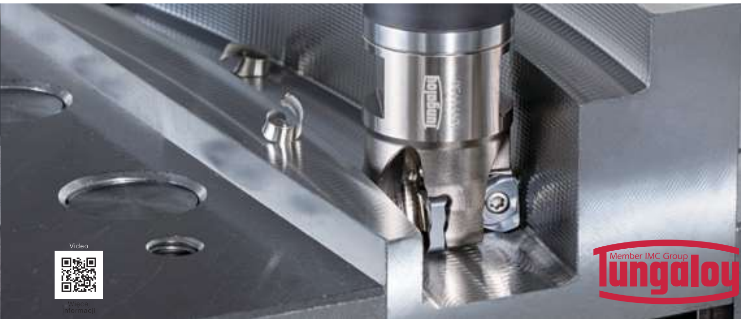
LNMX...HJ / HL Płytki do dużych posuwów