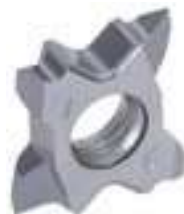
TCT18***-55/60... Częściowy zarys gwintu