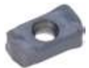
LN*U0303UER... Długa żywotność i mniejsze drgania.

Ograniczone do płytek w rozmiarze 03. Maksymalnie do 50 płytek