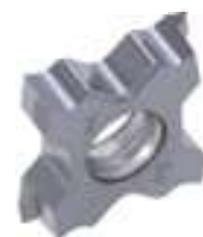
TCT18...-ISO/UN/UNJ/W Pełny zarys gwintu