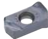
LN*U0303ZER... Niewielkie opory skrawania.